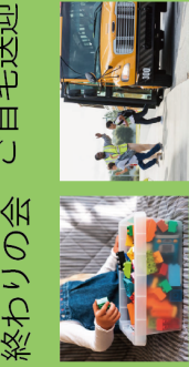
⑦ 片付け 終わりの会 ご自宅送迎